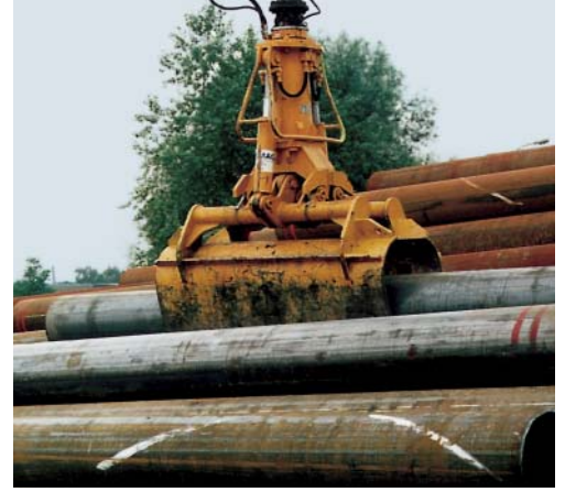
Rohrgreifer / Tube handling grab