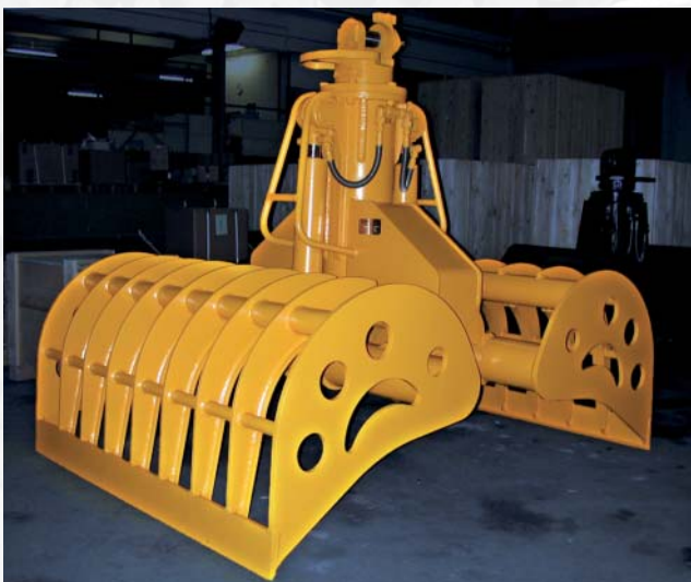
Müllgreifer Waste handling grab